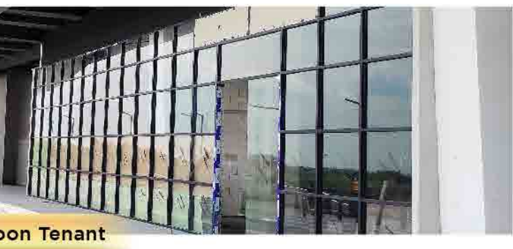
Coming Soon Tenant